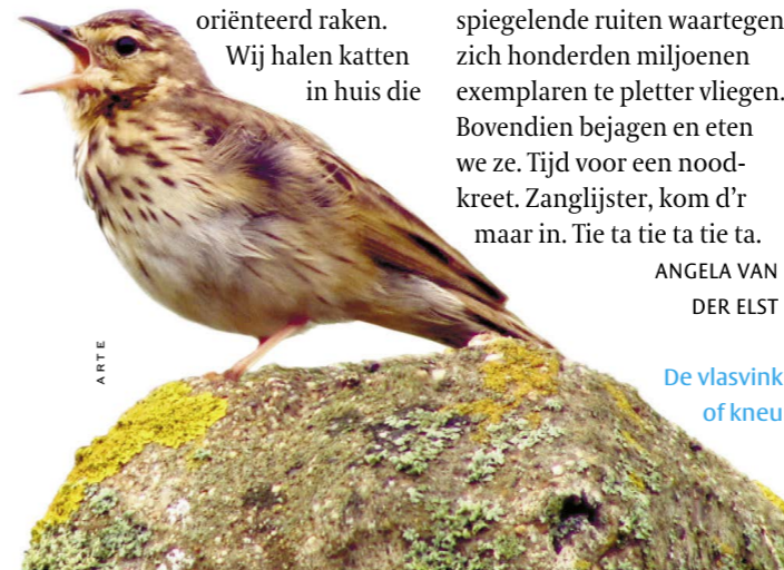
De vlasvink of kneu