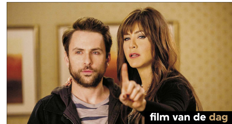
film van de dag

20.30-22.30 (NET 5) Horrible Bosses ★★★ USA 2011. Van Seth Gordon. Met oa Jason Bateman, Jason Sudeikis en Charlie Day. Kevin Spacey, Colin Farrell en Jennifer Aniston zijn de verschrikkelijke bazen uit de titel, vanwege onhebbelijkheden variërend van sadisme (Spacey en Farrell) tot ongewenste intimiteiten (Aniston). Werknemers Bateman, Sudeikis en Day zijn het zat en smeden een plan om elkaars bazen om te leggen. Vervelende bazen vermoorden is een onzalige opzet voor een komedie, maar deze film zit zo boordevol talent en schakelt zo snel tussen de minutieus uitgeschreven sketch-achtige scènes dat de toeschouwer geen moment de tijd krijgt om zich werkelijk te ergeren aan de sluimerende treurnis.